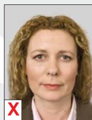
B. Optische vervorming