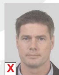
D. Onvoldoende contrast (flets)