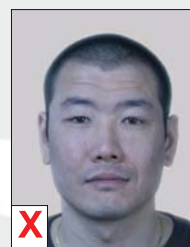
C. Onnatuurlijke weergave