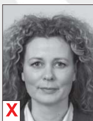
A. Zwart / Wit*